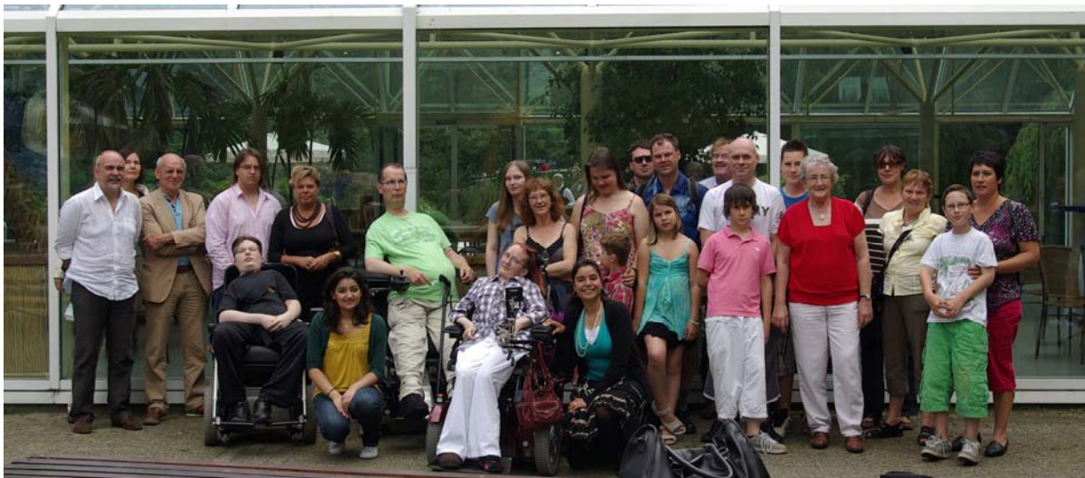
lotgenotendag in Artis