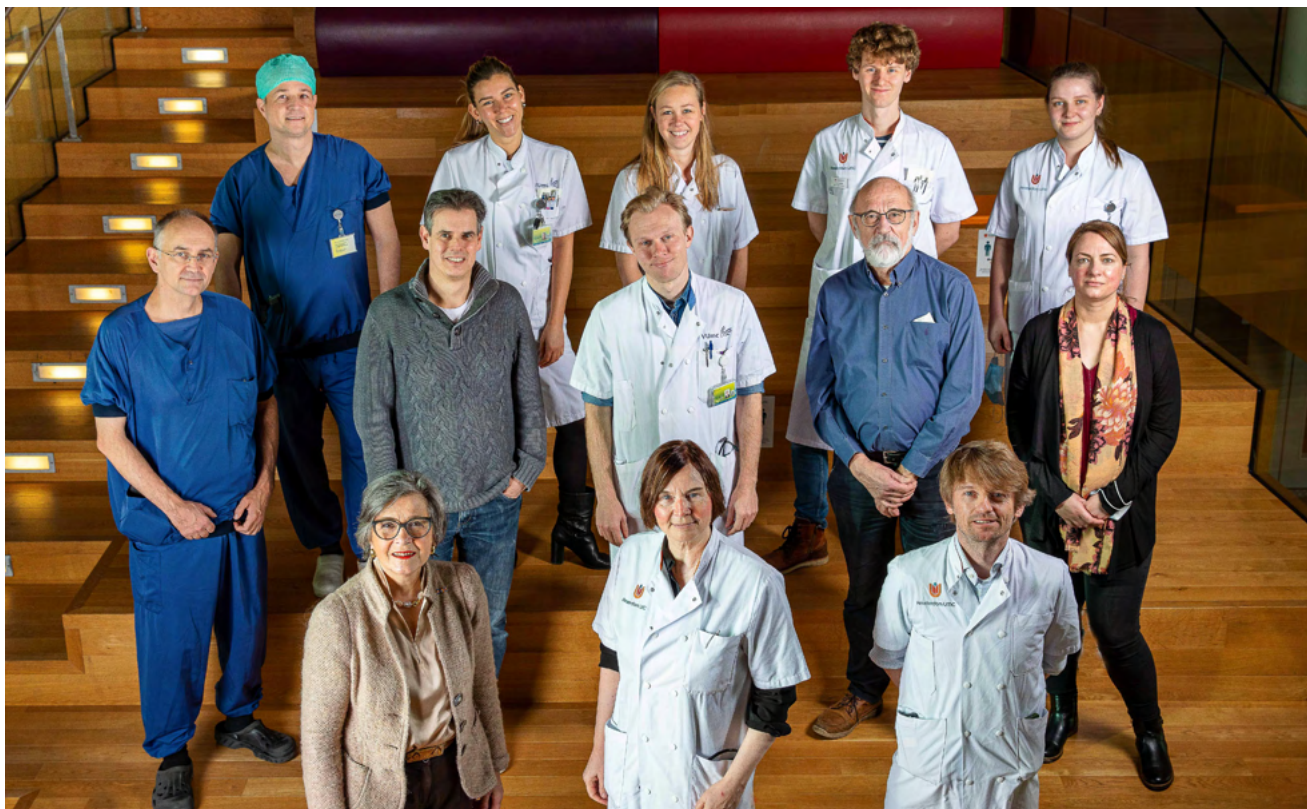
Ook deze prachtige foto van het team van het FOP Expertisecentrum in het VUmc werd door Geerke Vermeulen gemaakt voor het artikel in het AD.