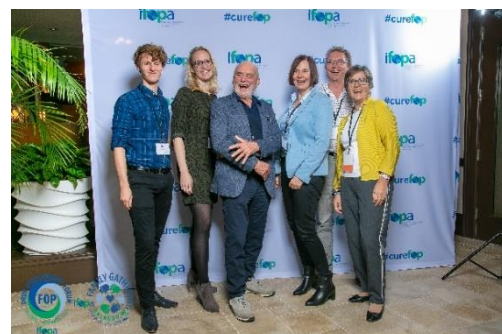
De Nederlandse delegatie op het congres in Orlando

Ook het preklinisch onderzoek wordt voortgezet. „Alles gaat nu via zoom. Hoewel het labonderzoek soms stilgelegd wordt, kan de uitwerking en