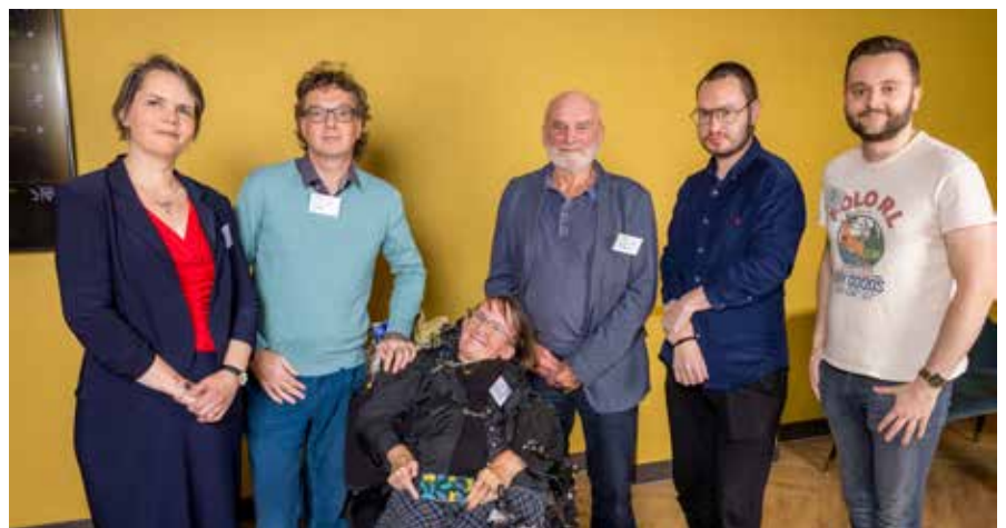
Het bestuur van FOP stichting Nederland